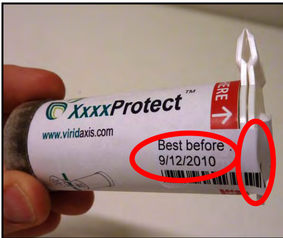
1.) Überprüfung des empfohlenen Verwendungsdatums ('best before') und der Unversehrtheit des Siegels.