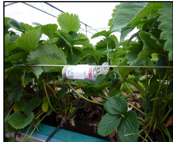
4.) Ausbringung 1 Röhrchen auf jeweils 200 m 2 Anbaufläche. Achtung: Vermeidung von direkter Sonne und Kondensations-Tropfstellen.