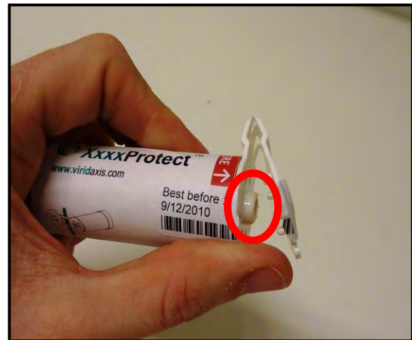
2.) Öffnen des Deckels (an der mit 'Open here' markierten Seite).