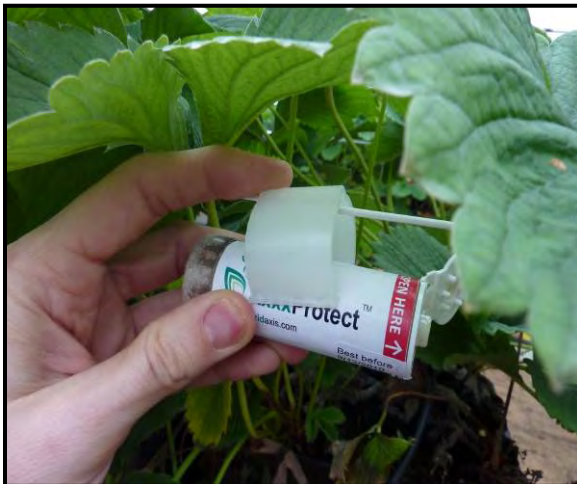
3.) Anbringen des Clips an einem waagrecht gespanntem Seil und Einrasten des Röhrchens.