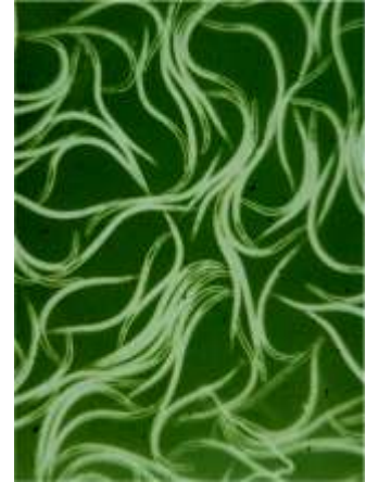
Nematoden unter dem Mikroskop