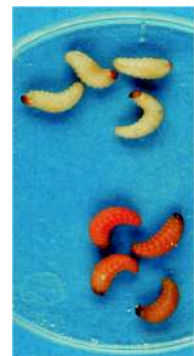
unparasitierte Larve (weiß) parasitierte Larve (rot-braun)

Bei Schädlingen mit kürzerer Generationsdauer wie z.B. Trauermücken ist die Befallskontrolle mittels Monitoringtafeln einfacher.