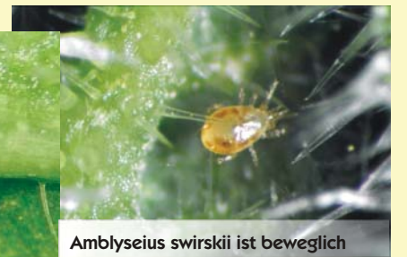
Amblyseius swirskii ist beweglich