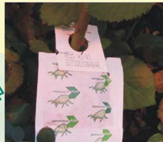
Amblyseius in Tüten