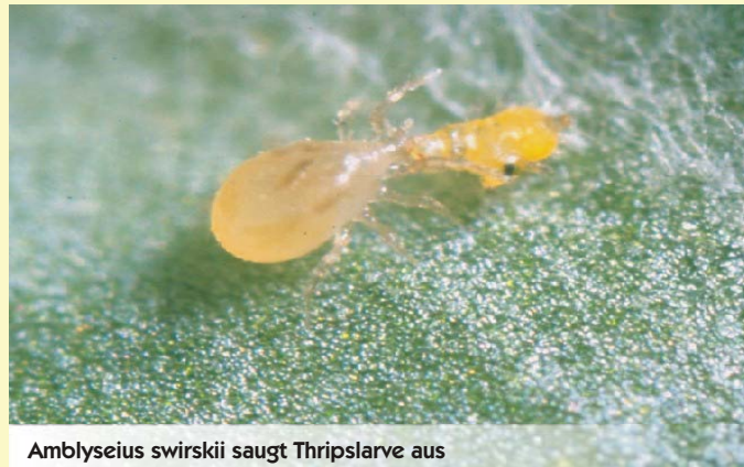
Amblyseius swirskii saugt Thripslarve aus