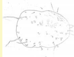
Wenig Haare 2 "lange" Haare