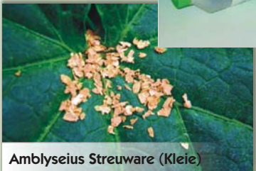
Amblyseius Streuware (Kleie)